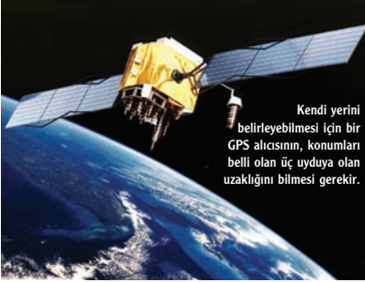
Kendi yerini belirleyebilmesi için bir GPS alıcısının, konumları belli olan üç uyduya olan uzaklığını bilmesi gerekir.

Bir yerin konumunu nokta olarak belirlemek için GPS uyduları ile GPS alıcıları birlikte çalışırlar. GPS uydusu sisteminin nasıl çalıştığını anlamak için, üçyanlılığın nasıl olduğunu anlamakta büyük yarar var.